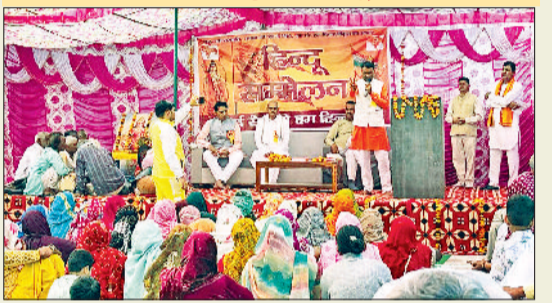
झज्जर। हिंदू सम्मेलन में संबोधित करते वक्ता।