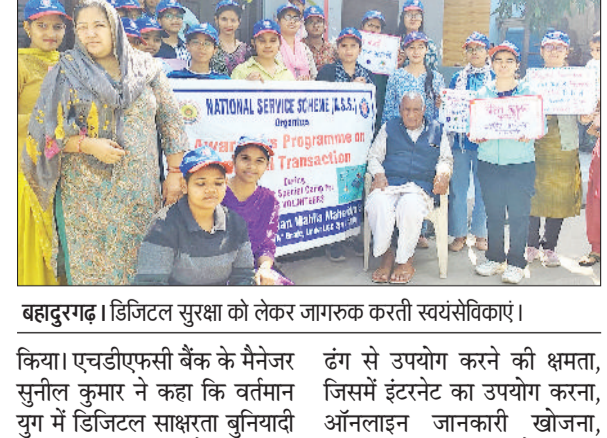
बहादुरगढ़। डिजिटल सुरक्षा को लेकर जागरूक करती स्वयंसेविकाएं।