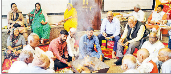
बहादुरगढ़। अनाज मंडी में हवन में आहुति डालते हिंदू समाज से जुड़े लोग।

संघ शताब्दी वर्ष के उपलक्ष्य में आर्य नगर, ओमेक्स, अनाज मंडी, लाइनपार, सेक्टर-2 व दयानंद नगर समेत 7 स्थानों पर कार्यक्रम