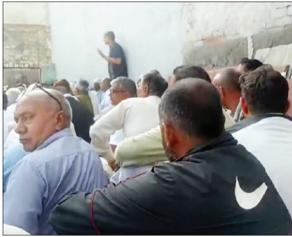
झज्जर। पंचायत में अपनी बात रखते ग्रामीण।

पंचायत में सैनिक स्कूल बनवाने व उसके लिए जमीन को स्कूल के नाम करने व स्कूल खोलने के बाद गांववासियों को होने वाले फायदों व सुविधाओं को लेकर चर्चा की गई। पूर्व विधायक