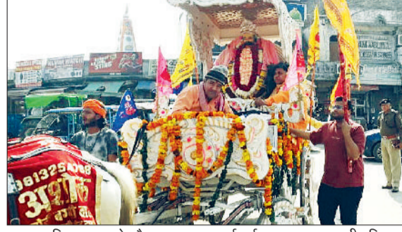
झज्जर। निशान यात्रा के दौरान रथ पर सजाई गई बाबा खाटूश्याम की प्रतिमा।