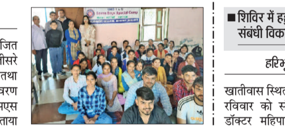
झज्जर। व्याख्यान कार्यक्रम के दौरान उपस्थित स्वयंसेवक।