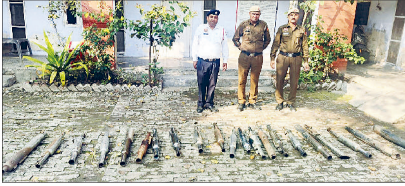
झज्जर। बुलेट मोटरसाइकिल से उतारे गए साइलेंसरों के साथ पुलिस कर्मी।