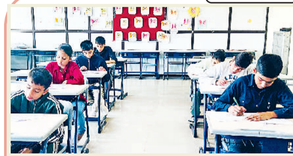
बहादुरगढ़। पीडीएम स्कूल में प्रवेश परीक्षा देते विद्यार्थी।