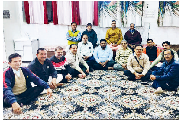
झज्जर। बैठक में उपस्थित मंदिर समिति सदस्य एवं पदाधिकारी।