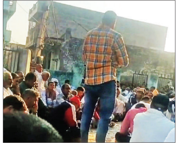
झज्जर। पंचायत में अपनी बात रखते ग्रामीण।