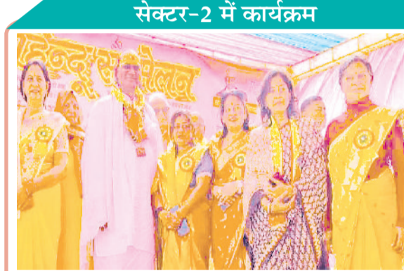
बहादुरगढ़। हिंदू सम्मेलन में मंच पर मौजूद मातृशक्ति।