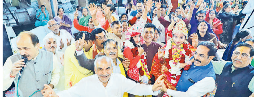
बहादुरगढ़। कथा समापन पर झूमते मंदिर पदाधिकारी व श्रद्धालु।