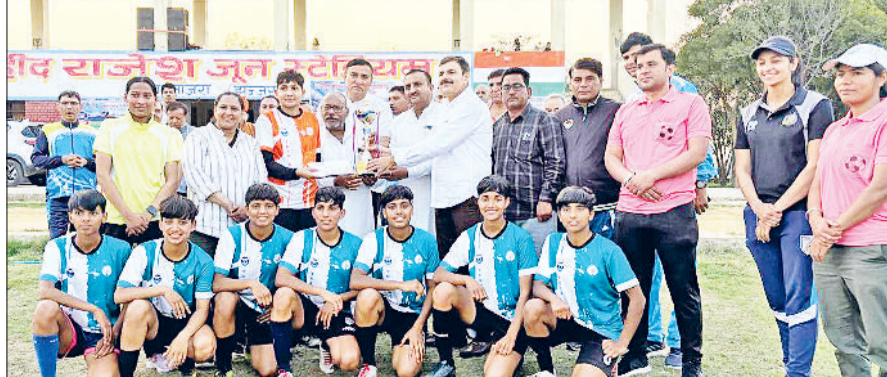
बहादुरगढ़। विजेता टीम को ट्रॉफी देते अतिथि व आयोजक।

गांव नूना माजरा में आयोजित दो दिवसीय पहली ओपन महिला फुटबॉल प्रतियोगिता रविवार को संपन्न हो गई। शानदार प्रदर्शन करते हुए फाइनल में कैथल को हराकर मंगाली हिसार ने खिताब अपने नाम किया। विजेता और उपविजेता टीम