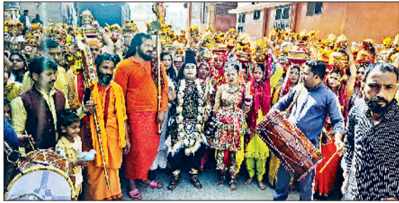
झज्जर। कलश यात्रा के दौरान उपस्थित भगवान शिव और माता पार्वती का रूप धारण किए हुए कलाकार।